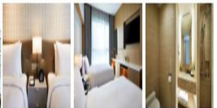
슈페리어 / 트윈(싱글+싱글)